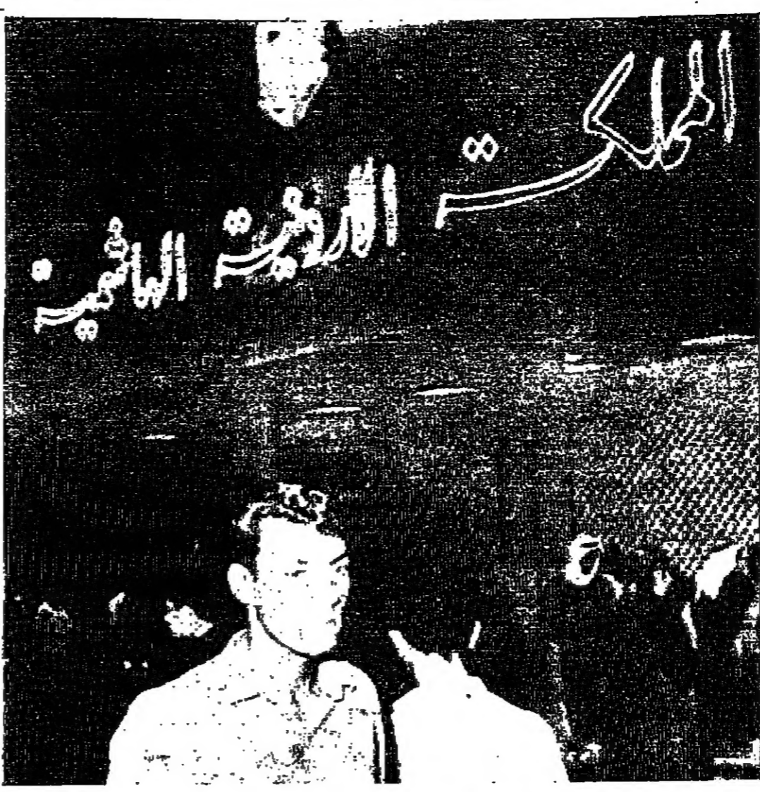
في كل ليلة من ليالي آخره .. كان عشرات الآلاف من الزوار يدخلون الجناح الأردني ، ويتجولون في ارجائه ، ويمججون بالهتاف الأردنية التي تترنم عروضا

قلت ما هي النشاطات الاخرى التي تمت في الجناح الأردني قال : هناك اذاعة حليبية تبث الاذاعة للاذاعات الأردنية .. كما قامت وزارة الاعلام بعرض بعض الافلام وهي « القروح » الذي عرض من خلاله خطاب جلال الملك اليعقوبية المهمة ليلة الامم المتحدة « وزهرة الدائن » الذي لاقى اقبالا منقطع النظير حيث تجمع الناس بالآلاف وسنوا الحفلات وهم يشاهدون بثوق هذا الفلم وقالوا بعادته اكثر من مرة .. هذا وقد تصادف ان تجمع الناس وهم يستمعون للاذاعة الأردنية وشكروا حفلات لتبث ..